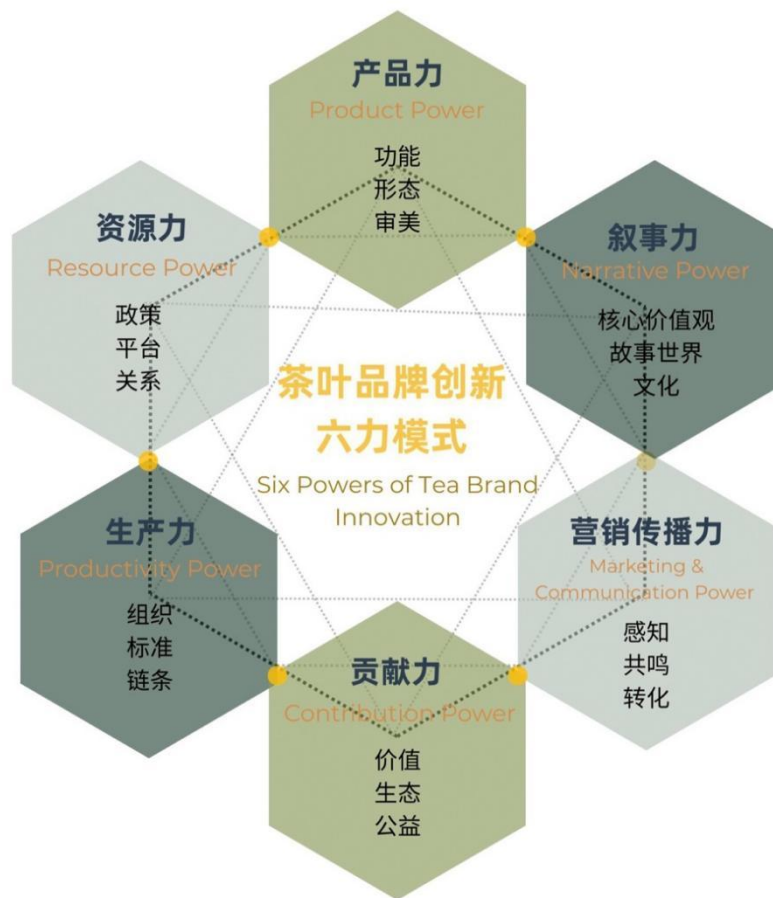
图 8.1.1 中国茶叶品牌创新六力模型

“中国茶叶品牌创新六力模型”并非对传统品牌逻辑的简单改写，而是一次面向当代中国茶产业、消费者心理、品牌战略与科技语境的系统性重构与本土化创新。它既服务于茶叶品牌升级，也具有跨行业品牌体系构建的启发意义。