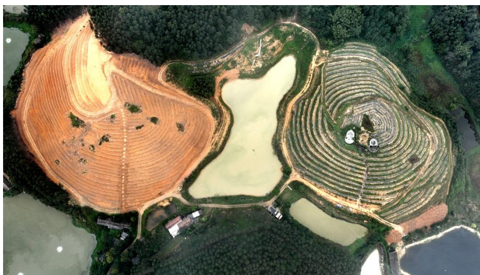
退桉还茶标准化茶园开发图

10. 对本标准化模式进行数据分析，归纳总结，编制鹤山市退桉还茶标准化执行标准，提出申请并争取通过成果评价鉴定。