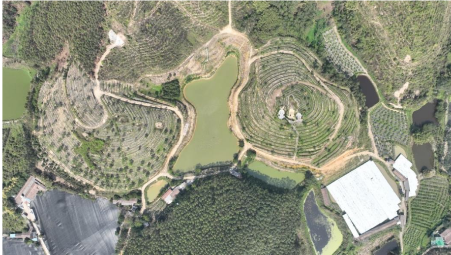
退桉还茶标准化茶园现状图